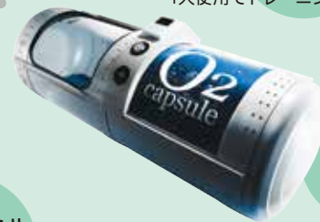
酸素カプセル (1人用)