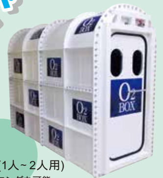
酸素ボックス(1人~2人用) 1人使用でトレーニングも可能