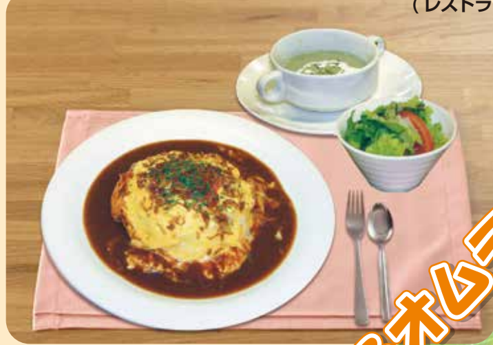
ふわとろオムライスセット 900円