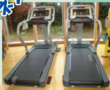
トレッドミル (ランニングマシン)

お客様から大好評の健康増進施設(フィットネスジム)では、人気のトレッドミルを4月に全台リニューアルしました。