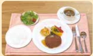
ハンバーグセット 1,200円