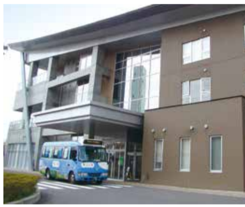
守谷駅西口からモコバスで約10分、いこいの郷・板戸井ルート「いこいの郷」下車、正面玄関に停留所があります。

お問合せ先 いこいの郷 常総(守谷市大木1468) ☎0297-48-3217 受付は午前9時から 休館日:毎月第2、第4火曜日