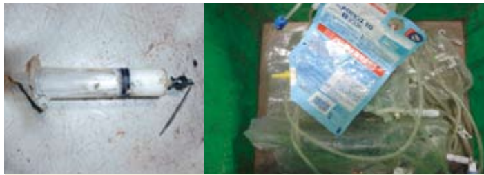
注射針など医療系廃棄物は、医療機関に返却してください。