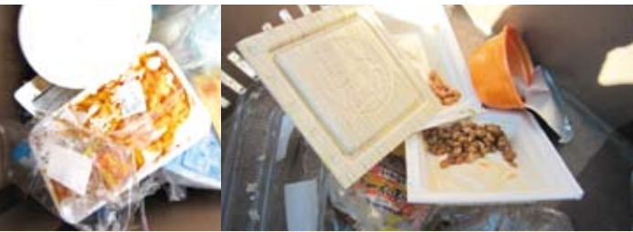
“中身”は残さずに取り除き、汚れたものは、拭き取るか、水で洗い水気を切ってください。