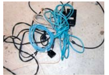
30cmに切って“不燃ごみ”で出してください。