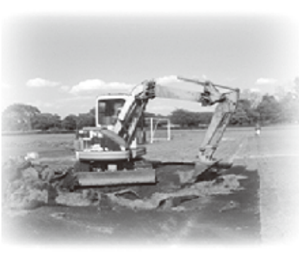
陸上競技場の除染作業

工事中には、運動公園の一部施設において立ち入りを制限させていただきます。皆様にはご不便をおかけしますが、ご理解とご協力をお願いいたします。