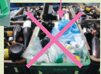
▲出し方が間違っている