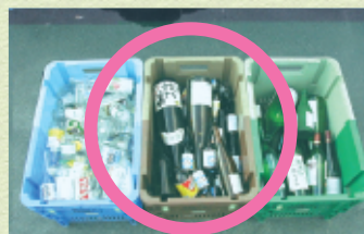
▲正しく出されている

みなさんが袋からだしてビンだけをコンテナに入れてくださると、作業員も一つ一つ袋からビンを取り出す作業をしなくてすみ、効率的な作業ができます。