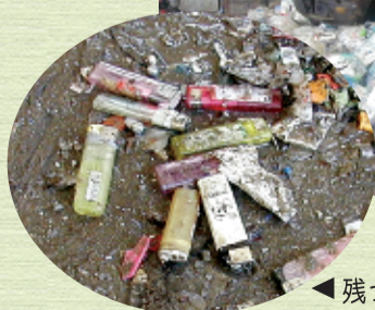
◀残っていたガスが発火したライター