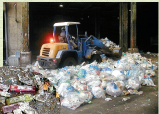
▲不燃ごみ前選別作業

平成17年度12月~2月の間に、使い捨てライターによる発火事故が4件発生しました。いずれも、不燃ごみとして出された使い捨てライターに残っていたガスが、前選別作業中に発火したものです。このような事故を防ぐために、使い捨てライターを捨てる時は、必ずガスを使い切ってから捨てるようお願いいたします。